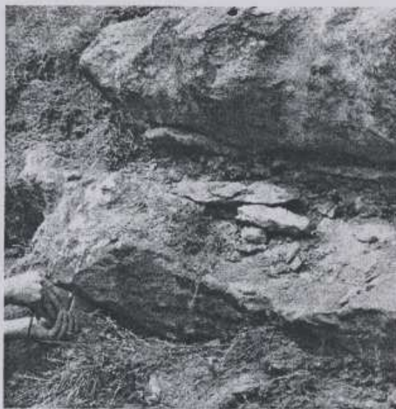
Slika 2. Slojevi željezovitih karbonatnih pješčara

Prvi veoma instruktivan profil nalazi se oko 70 m jugozapadno od B-6. Ovdje su markantni slojevi željezovitih karbonatnih pješčara debljine do 0,5 m (sl. 2.).